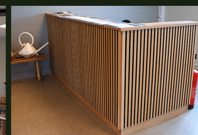
Receptionsdisken är platsbyggd. Väggarnas grå nyanser passar bra ihop med diskens omålade trä.