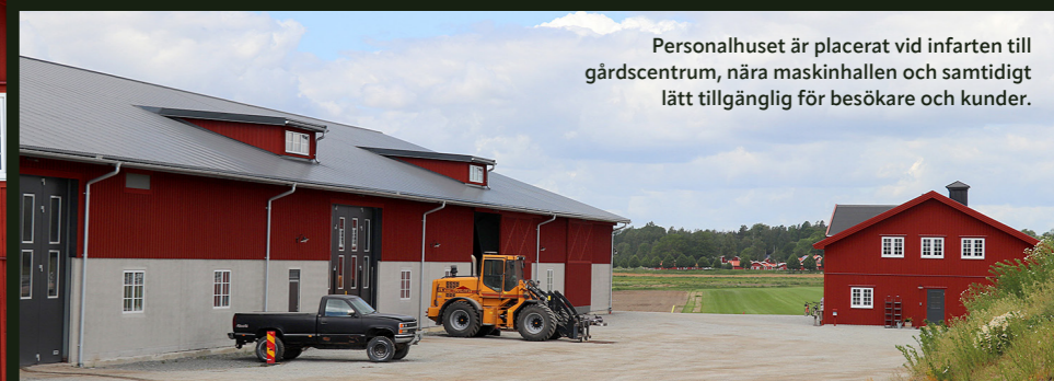
Personalhuset är placerat vid infarten till gårdscentrum, nära maskinhallen och samtidigt lätt tillgängligt för besökare och kunder.