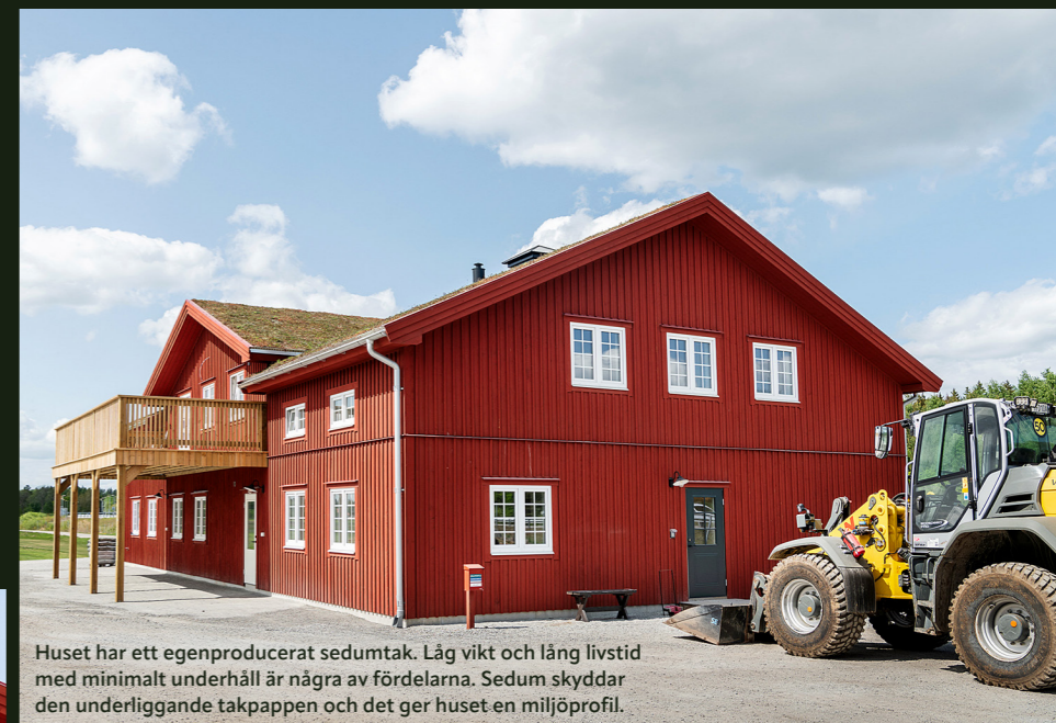
Huset har ett egenproducerat sedumtak. Låg vikt och lång livstid med minimalt underhåll är några av fördelarna. Sedum skyddar den underliggande takpappen och det ger huset en miljöprofil.