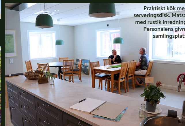
Praktiskt kök med serveringsdisk. Matsal med rustik inredning. Personalens givna samlingsplats.