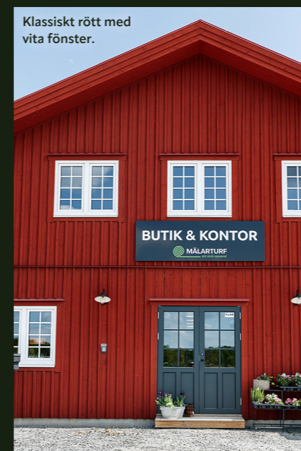
Klassiskt rött med vita fönster.