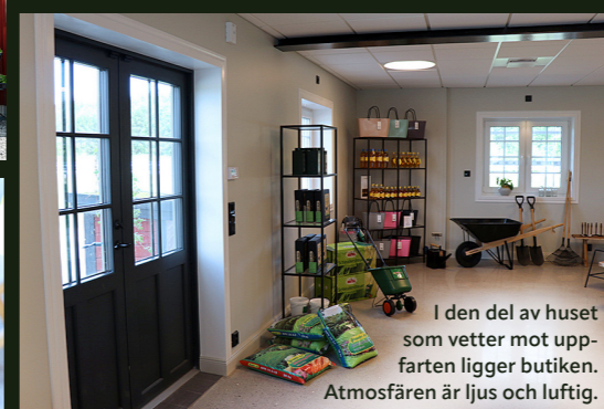
I den del av huset som vetter mot uppfarten ligger butiken. Atmosfären är ljus och luftig.