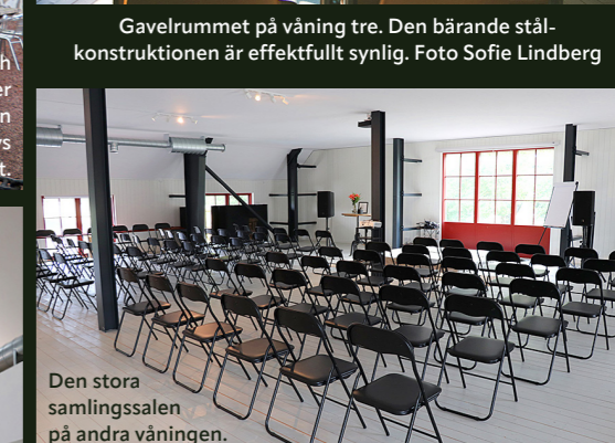
Den stora samlingshallen på andra våningen.