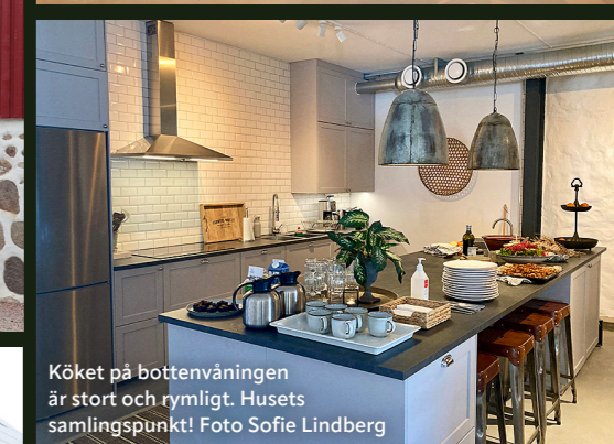
Köket på bottenvåningen är stort och rymligt. Husets samlingspunkt!