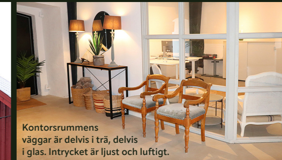
Kontorsrummens väggar är delvis i trä, delvis i glas. Intrycket är ljus och luftigt.