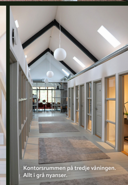
Kontorsrummet på tredje våningen. Allt i grå nyanser.

Många fler bilder finns på www.lantbruketsaffarer.se och i den digitala utgåvan.