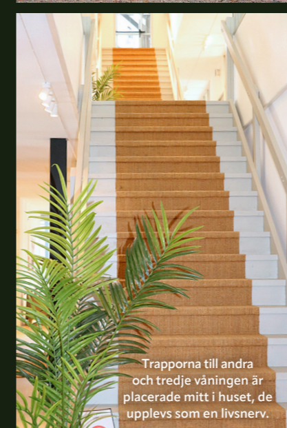
Trapporna till andra och tredje våningen är placerade mitt i huset, de upplevs som en livsnerv.