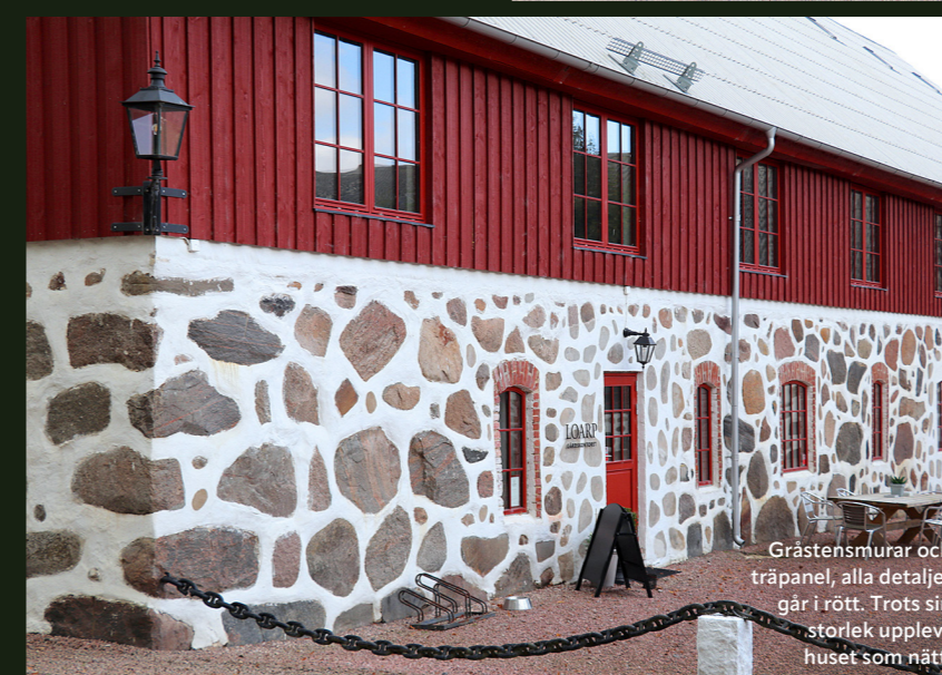
Gråstensmurar och träpanel, alla detaljer går i rött. Trots sin storlek upplevs huset som nätt.