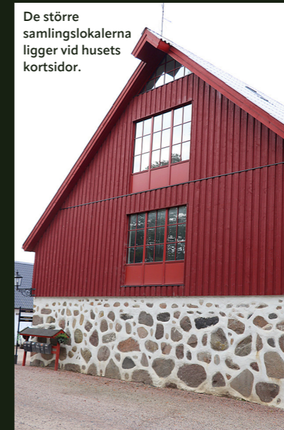
De större samlingslokalerna ligger vid husets kortsidor.

Kostnad: 3,5 miljoner kronor (utöver försäkringsersättningen)